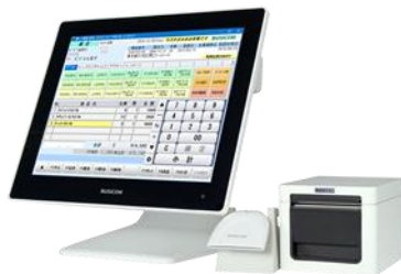
パソコンPOSシステム ハード一式約20万前後