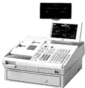
一体型POSシステム ハード一式約70万~100万前後